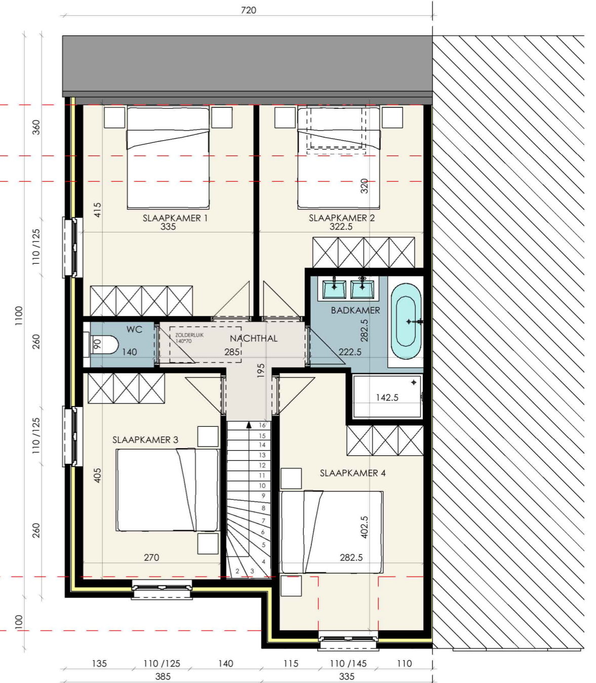
VERDIEPING LOT 15