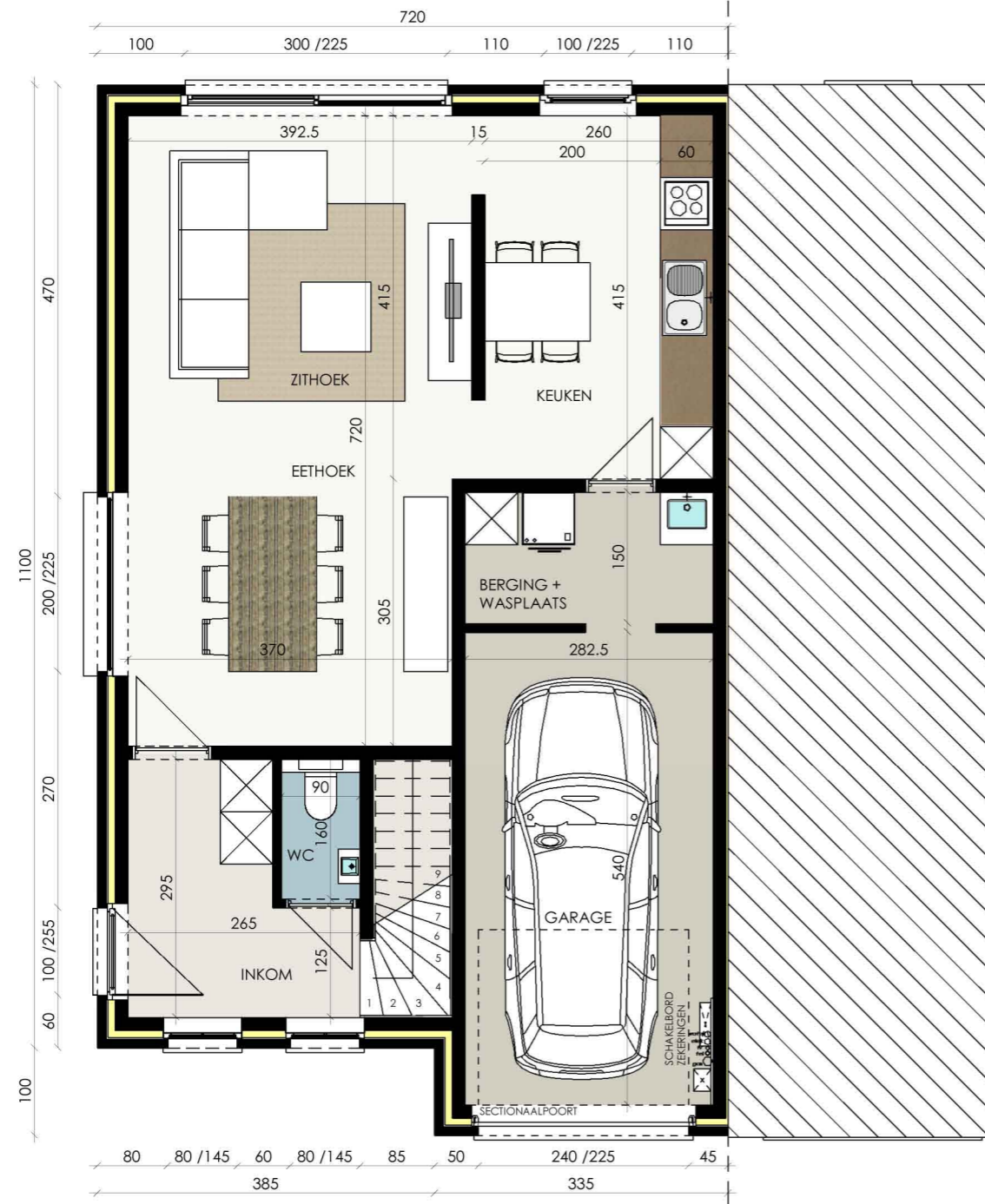
GRONDPLAN LOT 15